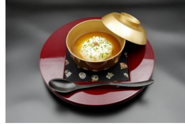
鱧と泉州水茄子のお椀