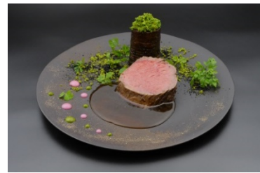
但馬牛の竹炭包み焼き