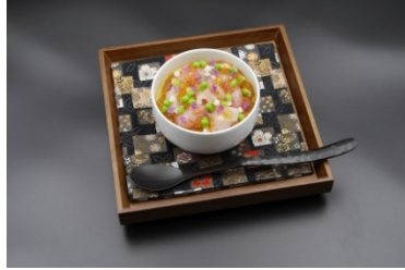
焼きトウモロコシのフラン