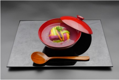
自然薯とレンコンの餅と色 鮮やかな根菜