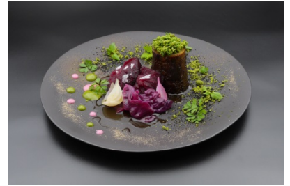
ビーツの炭火焼き